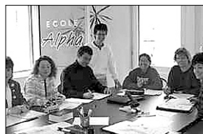
Das Ecole Alpha-Team in Siders.

Ecole Alpha, Siders Brauchen Sie Fremdsprachen für Ihre Arbeit, Hilfe bei einer wichtigen Examensvorbereitung, oder haben Sie ganz einfach Lust, eine neue Sprache und ihre Kultur kennen zu lernen? Nur zwei Minuten vom Bahnhof entfernt bieten wir Ihnen ein breites Angebot an Intensiv-, Abend- oder Privatkursen in verschiedenen